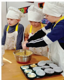
Des ateliers cuisine ...