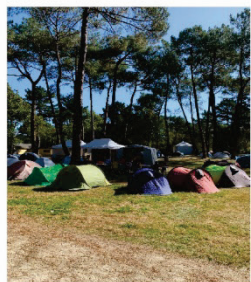
Des minis camps, des nuits étoilées ...