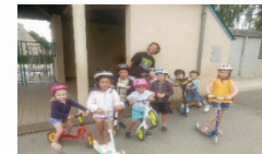
Des sorties vélos et parcours ...