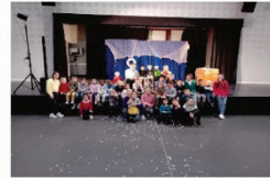
Des sorties : patinoire, à Tremelin, ciné ...