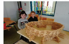
Des défis constructions ...