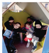
Des retrouvailles entre les copains, les copines ...