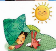
Des temps de repas, ne rien faire ... de l'oisiveté ...