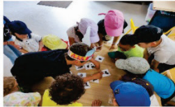
Des grands jeux ...