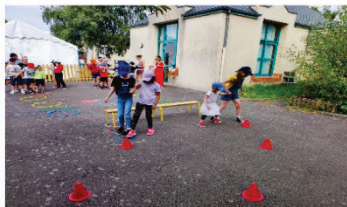
Des parcours sportifs ...